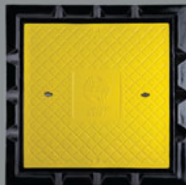
ابعاد 800x800 mm