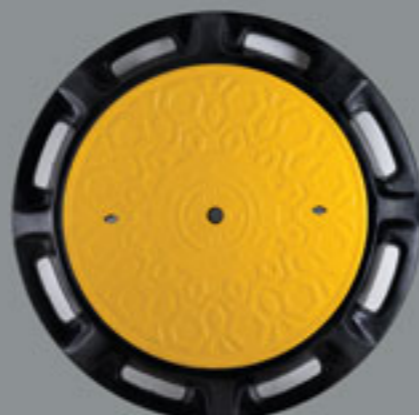
قطر 800 mm