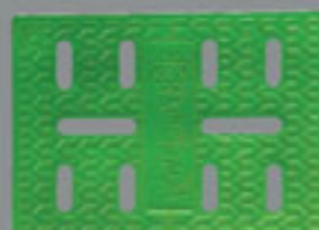
ابعاد: 500X700 mm