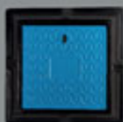
ابعاد: 400X400 mm