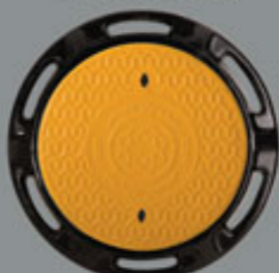
قطر: 600 mm