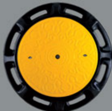
قطر: 800 mm