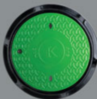
قطر: 600 mm